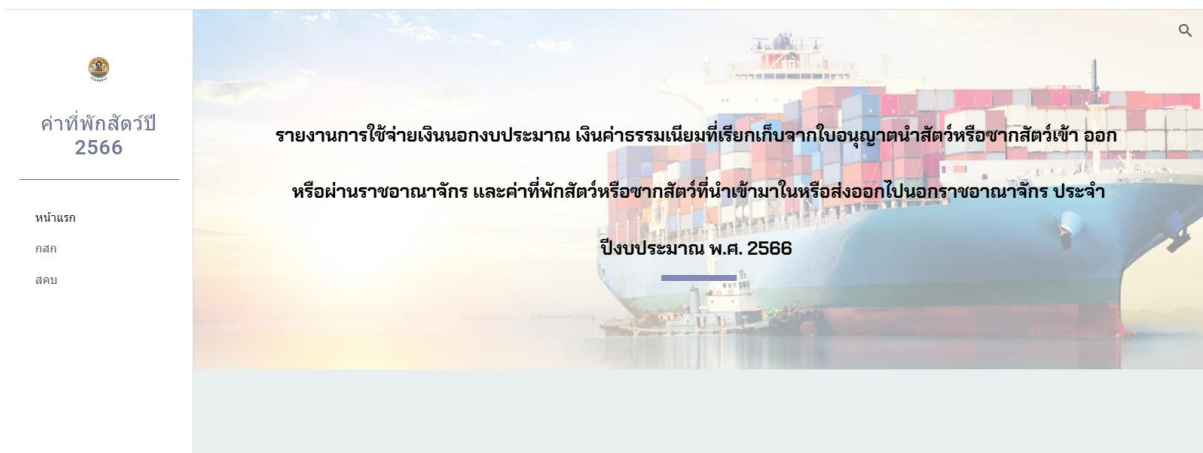
รูปภาพที่ 4

4. คลิกหัวข้อรายงานการใช้จ่ายเงินนอกงบประมาณ ค่าธรรมเนียมที่เรียกเก็บจากใบอนุญาตนำสัตว์หรือซากสัตว์เข้า ออก หรือผ่านราชอาณาจักร และค่าที่พักสัตว์หรือซากสัตว์ที่นำเข้ามาในหรือส่งออกป็นอกราชอาณาจักร ประจำปีงบประมาณ พ.ศ. 2566 จะพบหน้าแรกของการรายงาน แสดงตามรูปภาพที่ 4