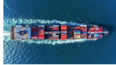
คลิก กลุ่มด่านกักกันสัตว์ที่ 9