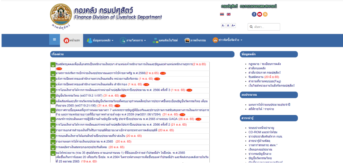
รูปภาพที่ 1

1. เปิดเว็บไซต์ กองคลัง กรมปศุสัตว์ https://finance.dld.go.th/th/index.php/th/ ตามรูปภาพที่ 1