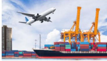
คลิก กลุ่มด่านกักกันสัตว์ที่ 8