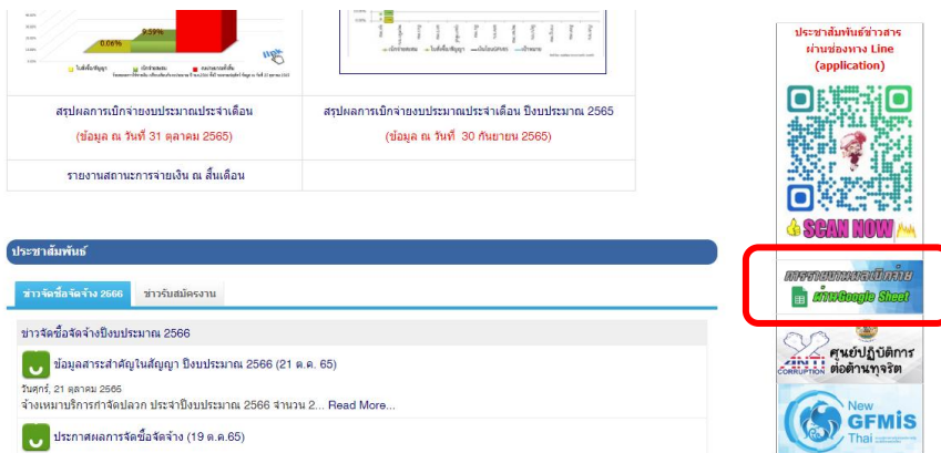
รูปภาพที่ 2

2. เลือก web banner หัวข้อ “การรายงานผลเบิกจ่ายผ่าน Google Sheet” ตามรูปภาพที่ 2