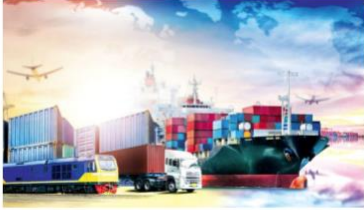
คลิก กลุ่มด่านกักกันสัตว์ที่ 7