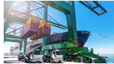
คลิก กลุ่มด้านกักกันสัตว์ที่ 3

ด้านกักกันสัตว์สระแก้ว ด้านกักกันสัตว์นครนายก ด้านกักกันสัตว์ปราจีนบุรี ด้านกักกันสัตว์ฉะเชิงเทรา ด้านกักกันสัตว์ตราด ด้านกักกันสัตว์ฉะเชิงเทรา ด้านกักกันสัตว์ชลบุรี