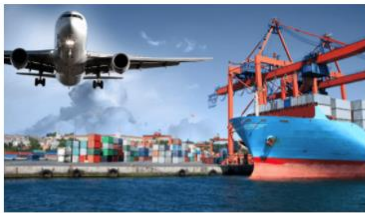
คลิก กลุ่มด้านกักกันสัตว์ที่ 4

ด้านกักกันสัตว์มุกดาหาร ด้านกักกันสัตว์หนองคาย ด้านกักกันสัตว์เลย ด้านกักกันสัตว์นครพนม ด้านกักกันสัตว์อุดรธานี ด้านกักกันสัตว์ขอนแก่น ด้านกักกันสัตว์มหาสารคาม