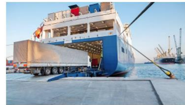
คลิก กลุ่มด้านกักกันสัตว์ที่ 6

ด้านกักกันสัตว์แม่ฮ่องสอน ด้านกักกันสัตว์เชียงใหม่ ด้านกักกันสัตว์เชียงราย ด้านกักกันสัตว์น่าน ด้านกักกันสัตว์พะเยา ด้านกักกันสัตว์ลำปาง ด้านกักกันสัตว์ลำพูน ด้านกักกันสัตว์แพร่