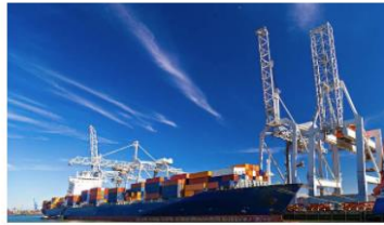
คลิก กลุ่มด้านกักกันสัตว์ที่ 2

ด้านกักกันสัตว์สุพรรณบุรี ด้านกักกันสัตว์ลพบุรี ด้านกักกันสัตว์สระบุรี ด้านกักกันสัตว์ชัยนาท ด้านกักกันสัตว์พระนครศรีอยุธยา