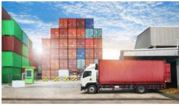
คลิก กลุ่มด้านกักกันสัตว์ที่ 1

เมื่อเลื่อนลงด้านล่างจะพบลิงค์เว็บไปหน้า Google Sheet ของกลุ่มด้านกักกันสัตว์ทั้ง 9 กลุ่ม แสดงตามรูปภาพที่ 9 – 11