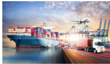
คลิก กลุ่มด้านกักกันสัตว์ที่ 5

ด้านกักกันสัตว์มุกดาหาร ด้านกักกันสัตว์หนองคาย ด้านกักกันสัตว์เลย ด้านกักกันสัตว์นครพนม ด้านกักกันสัตว์อุดรธานี ด้านกักกันสัตว์ขอนแก่น ด้านกักกันสัตว์มหาสารคาม