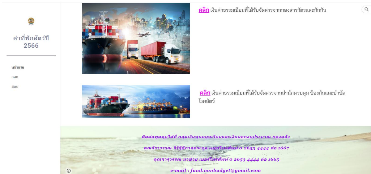
รูปภาพที่ 6