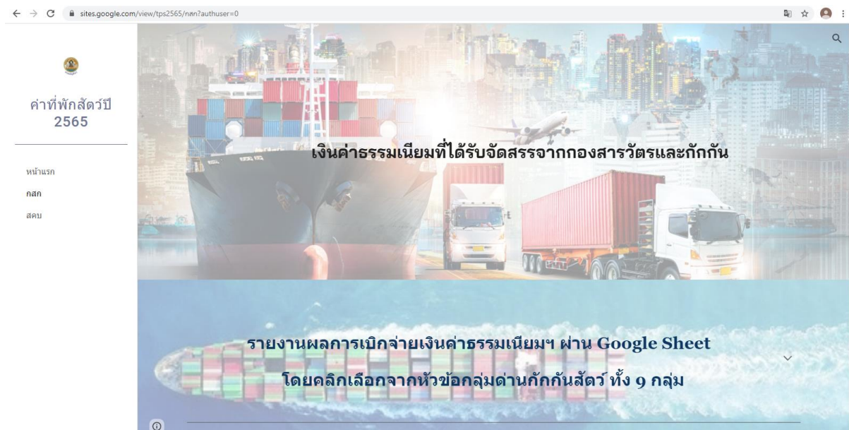
รูปภาพที่ 8

6. เข้าสู่หน้าเพจเงินค่าธรรมเนียมที่ได้รับจัดสรรจากกองสารวัตรและกักกัน ให้รายงานผลการเบิกจ่ายเงินค่าธรรมเนียมฯ ผ่าน Google Sheet โดยคลิกเลือกจากหัวข้อกลุ่มด่านกักกันสัตว์ ทั้ง 9 กลุ่ม แสดงตามรูปภาพที่ 8