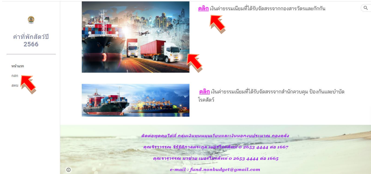
รูปภาพที่ 7

5. ให้เลือกเข้าไปรายงานการใช้จ่ายเงินค่าธรรมเนียมฯ โดยกดลิงค์เว็บ ตรงคำว่า กสก (1) ที่เมนูทางลัด ด้านซ้ายมือ , รูปภาพ (2) หรือคำว่า คลิก (3) ด้านหน้าหัวข้อ เงินค่าธรรมเนียมที่ได้รับจัดสรรจากกองสารวัตรและกักกัน ตามรูปภาพที่ 7